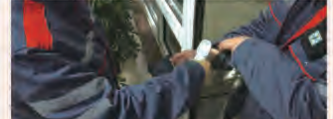
测量体温，疫情期间防护未然，安全防护从我们自身做起。