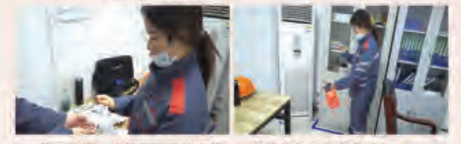
疫情防控，加强工作区域的消毒工作