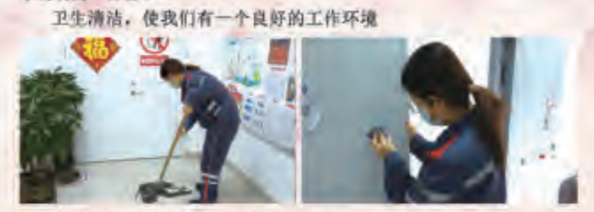
卫生清洁，使我们有一个良好的工作环境

世上有各式各样的花朵，她们的花香是蜜蜂的养料，每一个不同花朵，都包含着不一样的话语，有祝福的、有爱情的、有努力的、有悲伤的，我们集体有一个特别的花朵——她叫员工。是我们仓储最不起眼却又不可或缺的一部分。