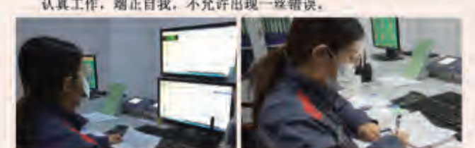
认真工作，端正自我，不允许出现一丝懈怠。